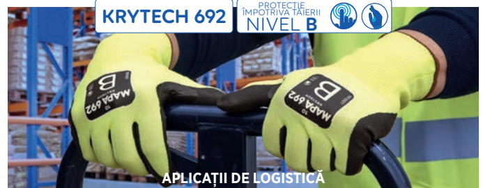
APLICAȚII DE LOGISTICĂ