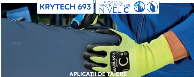
APLICAȚII DE TĂIERE