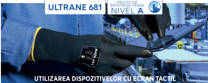
UTILIZAREA DISPOZITIVELOR CU ECRAN TACTIL