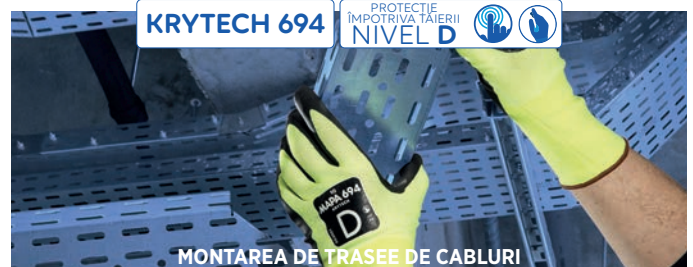
MONTAREA DE TRASEE DE CABLURI